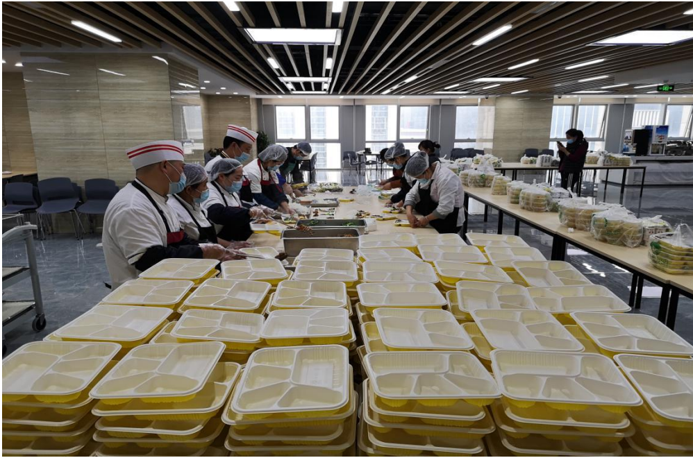
（图为食堂进行有序分餐）

一瓶瓶消毒液、一个个口罩、一包包按钮纸巾，一句句温馨的提示、一次次抬手测温、一餐餐可口的饭菜……这一件件细小贴心的“细”事“小”事背后，是无数后勤干部职工的默默坚守和付出，是第八党支部党员干部顾大局、守纪律、讲奉献的担当和作为。