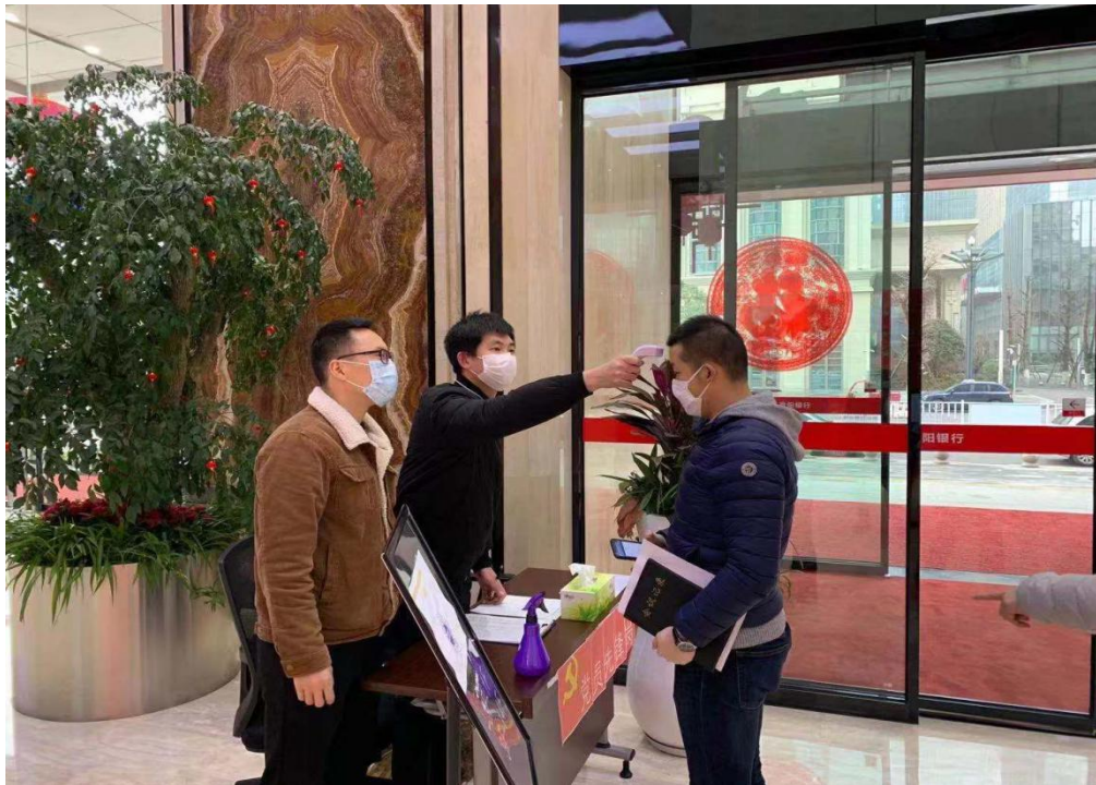
（图为党员先锋岗同志对进入大楼人员进行体温测量）

他们终将采购的物资顺利运回。口罩是紧缺物资，政府统一调配，市场采购极为困难，针对这一情况，行主要领导亲自协调，后勤事务部具体执行，前后通过各种渠道筹集，解决了防控工作的燃眉之急。截至目前，36500个口罩，41000个口罩内衬，860斤酒精，2100斤消毒液，最大程度地满足了全行干部员工的防护需求。